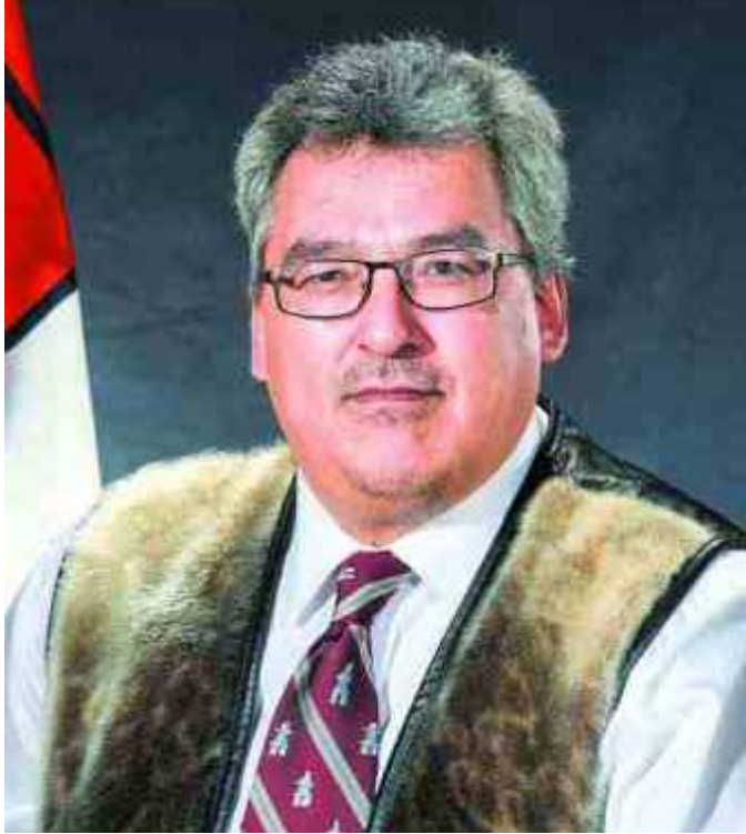
L'hon. Simeon Mikkungwak