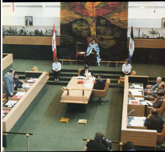
Journal of the Commonwealth Parliamentary Association, Canadian Region.