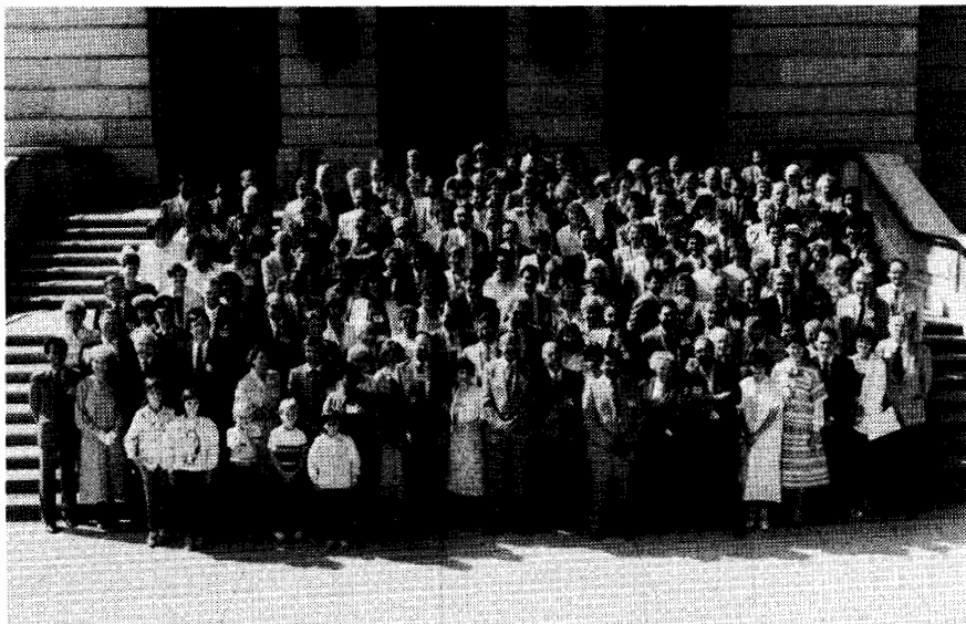
Les délégués et observateurs à la conférence régionale

Cette conférence régionale s'est déroulée tandis que l'Assemblée législative siégeait et, même si cela a compliqué la tâche des organisateurs, la rencontre n'en a pas moins connu un succès retentissant.